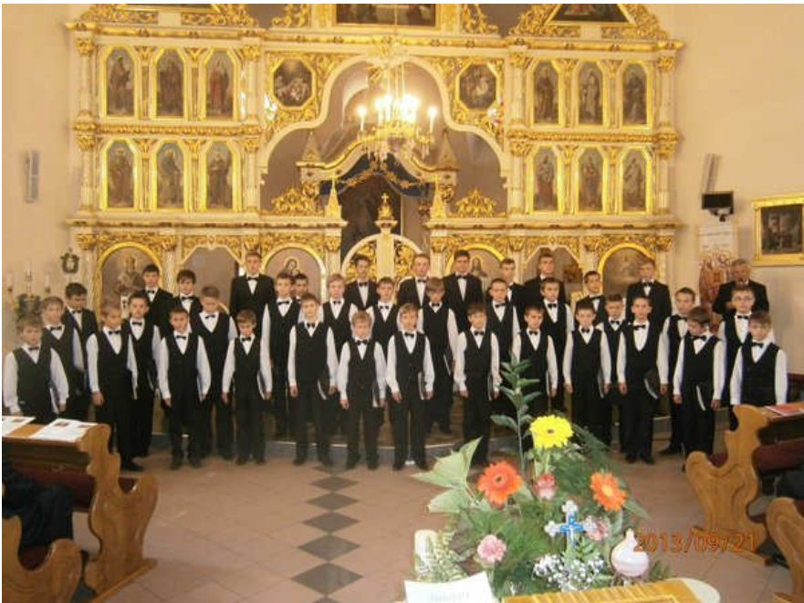
Chlapčenský zbor hudobnej školy, Mukačeva - UKRAJINA