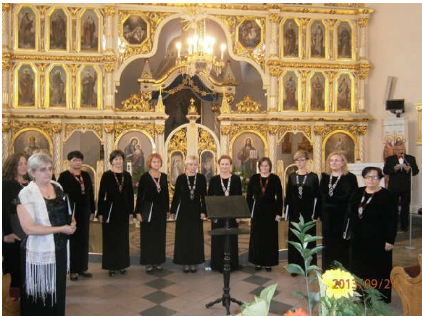
Żeński Kameralny Chór Namysto, Przemysl - POLSKO