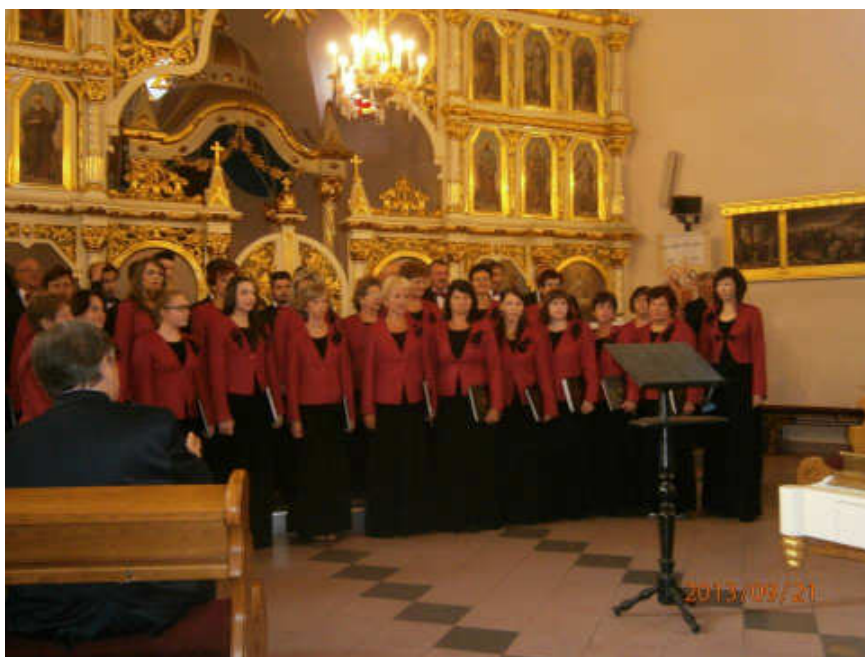
Gréckokatolícky chrámový zbor bl. P. P. Gojdiča, Vranov nad Topľou - Čemerné